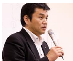
株式会社ザメディアジョン 代表取締役兼CEO